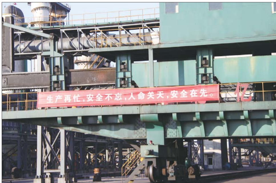
博兴县诚力供气有限公司一角。(资料图)

2013年12月14日公司组织了博兴县诚力供气有限公司“安康杯”安全知识竞赛活动,内容包括安全生产知识、安全管理知识、生产工艺知识等方面。进行安全宣传活动,制作安全宣传标语30条、35余幅,分别在公司大门、生产区悬挂。并将国家和公司安全方针、公司负责人安全承诺书、化工企业四十一条禁令、公司安全教育、安全检查、应急救援演练的安全宣传资料