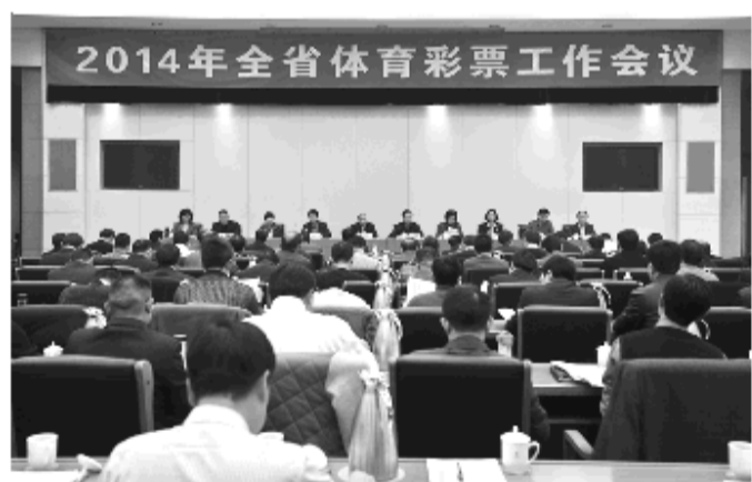
公益金92.91亿元,为各项社会公益事业和体育事业做出了积极贡献。省体彩中心连续连续4年保持“省级文明单位”、连续多年保持“青年文明号”荣誉。(陈洪)

2013年,我省体彩事业保持了稳定健康发展的势头,年销量达122.42亿元,再创历史新高,同比增长16.44亿元,每举体彩