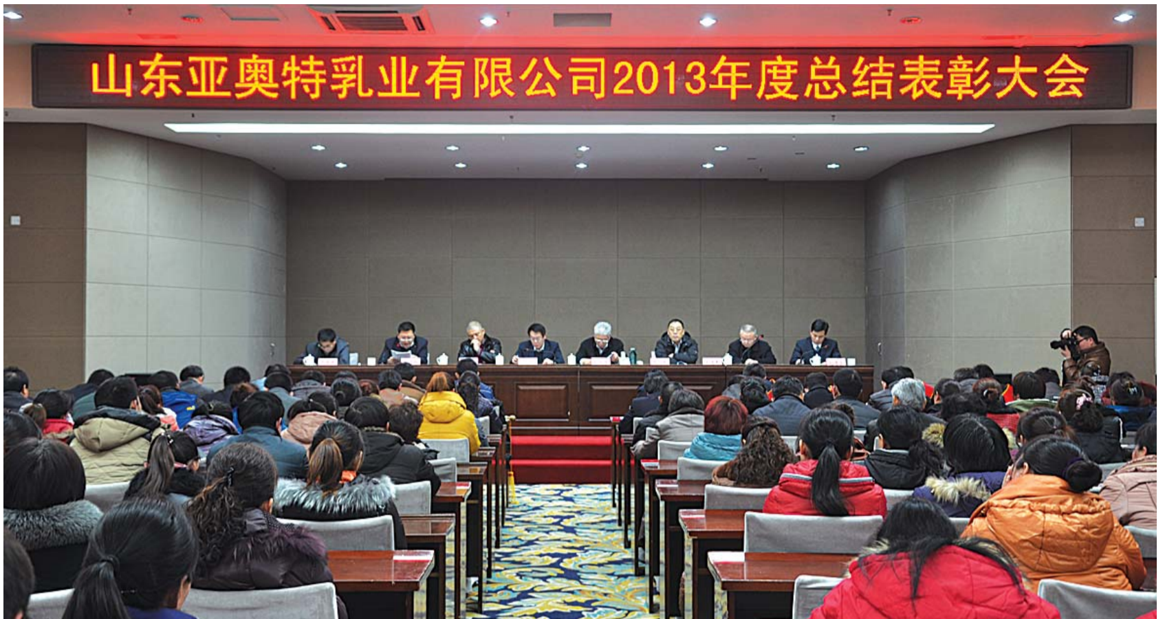
亚奥特乳业2013年度大会现场。