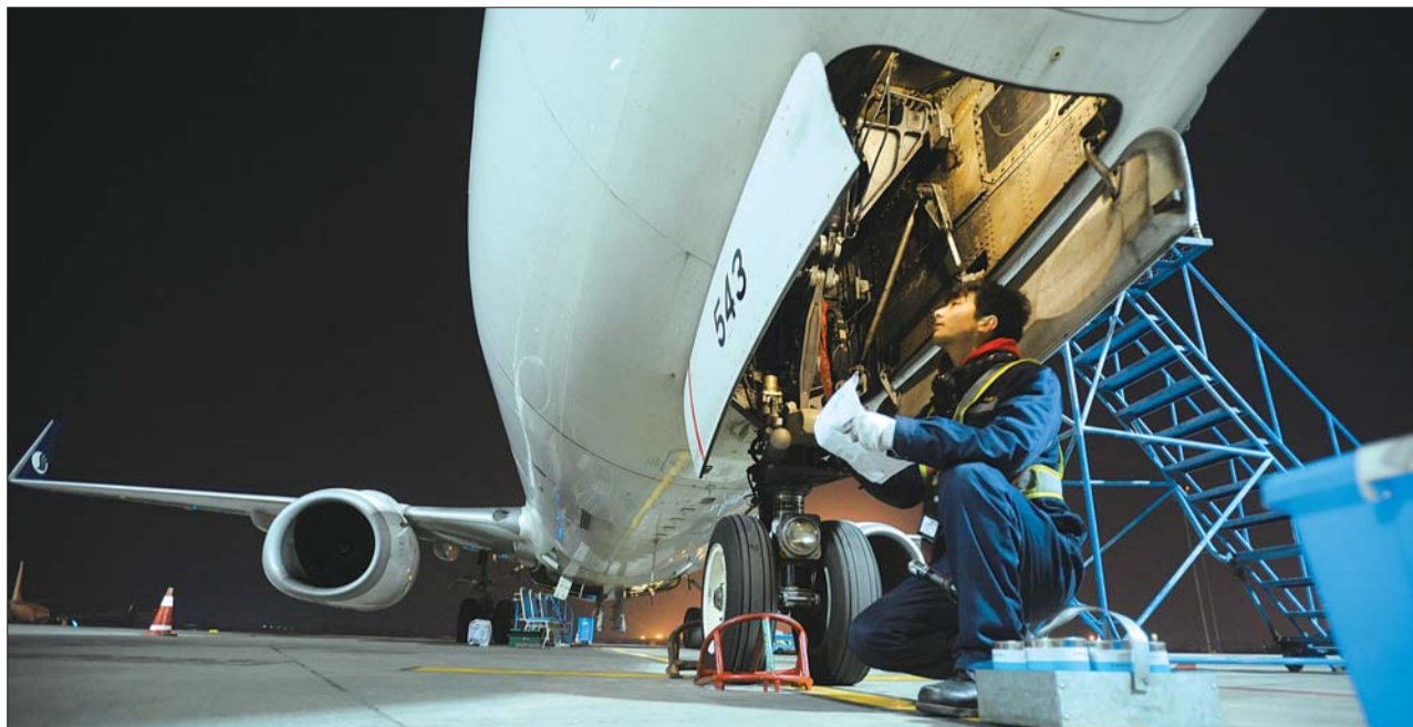
打开飞机腹部,一项一项严格按照程序检查。