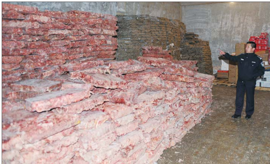
民警查获冷库储藏的病死鸡达20余吨。

近日,芝罘公安分局食品药品与环境犯罪侦查大队捣毁一涉嫌加工销售病死鸡的窝点,抓获5名犯罪嫌疑人,查获库存病死鸡达20余吨。该犯罪团伙利用自己的加工厂、冷库及销售渠道,实施一条龙犯罪,不少病死鸡流向了百姓餐桌。从2012年年底起,这笔非法买卖就使犯罪嫌疑人赚了数十万黑心钱。