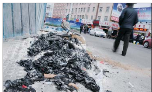
路边还留有被烧毁的痕迹。

本报热线6610123消息(记者 王永军) 9日下午4点多,烟台汽车总站附近一处工地的电缆起火。消防官兵赶到后,火势很快得到了控制。据维修工作人员介绍,可能是工地电缆短路引发火灾,影响较小,事故中没有人员受伤。