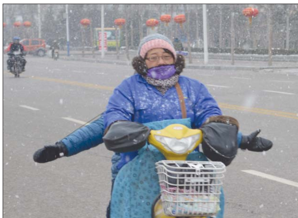
9日中午,泰安又迎来降雪,一孩子坐在电动车后座上接雪花。

9日,记者从泰安市气象台获悉,受较强冷空气影响,截至12日,泰安将经历持续低温天气,最低气温出现在10早晨,达