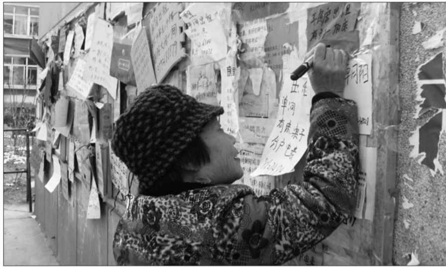
11日,张店道庄小区住户在张贴房屋出租信息。

“不仅房租上涨了,房东的要求也高了,很多房东要求一次性交房租就要半年甚至一年。”11日,正在找房子的杨女士告诉记者。据了解,节后租房市场突然火爆,有的市民找了半月还没找到合适的房源,而房租平均也涨了200多元。