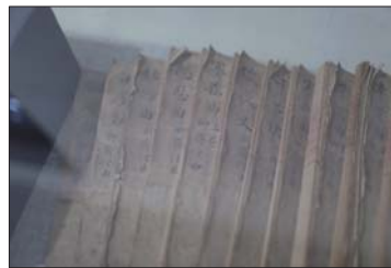
蒲松龄纪念馆展出的古俚曲曲谱。

齐鲁晚报 今日淄博 C05 2014年2月12日 星期三 编辑：齐鲁 美编：朱金阁