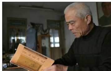
对于蒲松龄的研究蒲章俊从来没有间断过。