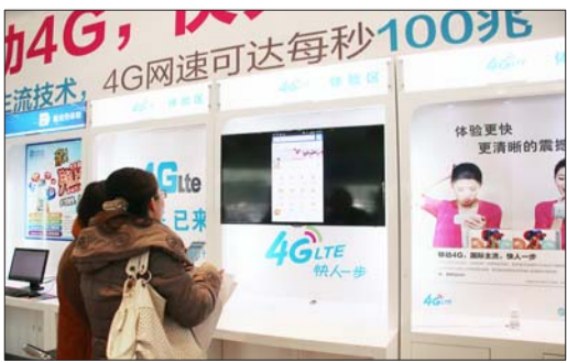
市民正在体验4G网络下手机与电视的屏幕共享。