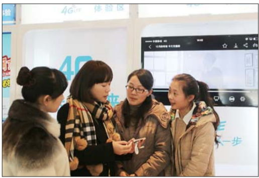
工作人员在介绍4G网络的使用方法。

4G网络在省内,如济南、青岛等一些城市早已开始使用,对于4G网络的速度,枣庄市民也只是能从网络上了解到一些而已。近日,记者从中国移动山东公司枣庄分公司了解到,1月17日,移动版iPhone5s、iPhone5c现身枣庄移动营业厅,并且已经有市民开始抢购。2月11日,记者带着好奇和疑问,走进了中国移动光明西路营业厅,亲身体验了一场移动4G网络的极速之旅。