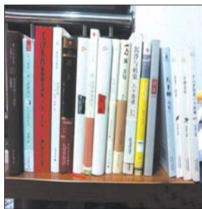
@颤抖的牛腿开出的书单

@亚来: 2013年读的少且杂,十佳缩成六佳。胡兰成《今生今世》、《意犹未尽:胡兰成书信集》,巫宁坤《一滴泪》,王鼎钧《昨天的云》,茅海建《天朝的崩溃》以及鲍鹏山《风流去》。