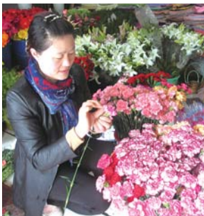
梦云花艺情人节鲜花预订中。

位于新市区泰安路国际大厦对过,主要提供生日送花、爱情送花、结婚纪念送花等鲜花速递服务,同时经营开业花篮、商