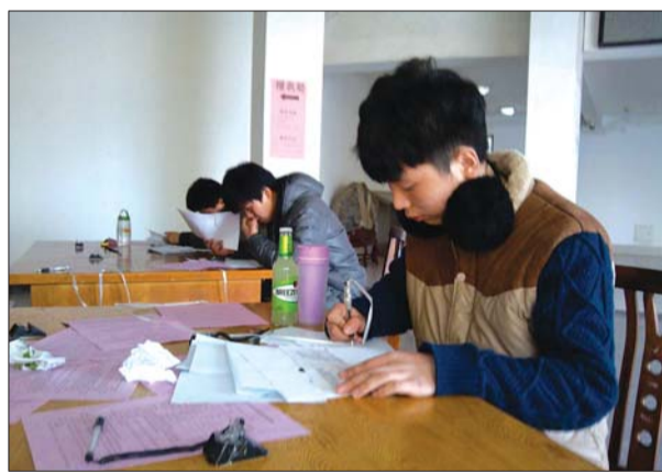
考生在报名处填写报名表。 达设计5人,环境设计5人。 “专业考试全部结束后,泰山学院将按考生所报专业、专业类别分别进行排名。专业考

泰山学院教务处宋涛老师说,现在省内院校有广播电视编导专业的不算太多,这个专业一向报名人数很多,大家都想给自己增加一个机会。据介绍,泰山学院2014年计划招收的800名艺体类专业学生中,省内计划为740人,包括音乐学50人、舞蹈学100人、播音与主持艺术70人、音乐表演30人、广播电视编导80人、美术学120人、视觉传达设计65人、环境设计65人、体育教育120人、社会体育指导与管理40人。省外计划为60人,包括音乐学30人、音乐表演15人、舞蹈学5人、视觉传