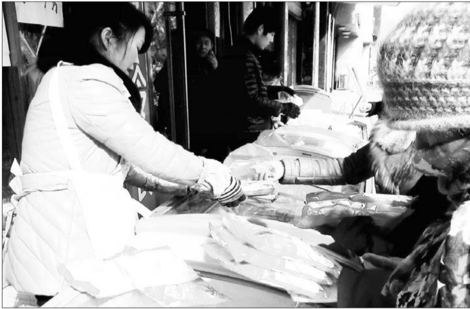
市民在购买元宵。

记者在采访中发,由于2月14日也是西方的情人节,不少特色的饭店、咖啡店、茶餐厅同时也打出了“节日牌”,为前来就餐的客人提供鲜花、汤圆、“情侣套餐”等各种特色服务。(于鹏)