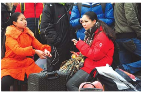
累了,坐箱子上歇歇。

几个和她一起来考试的学生说,他们白天要去各地考试,吃饭很不方便,大多时候为了保持身材每天只吃一顿晚饭。“大多时间我们都在路上,每天在床上只能睡两三个小时,最早凌晨三点就得起床赶往下一个考点,在车上迷糊着睡会。”