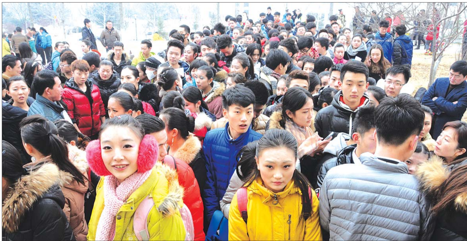
青春的脸庞充满证明自我的渴望,在艺考的道路上,他们还要继续奔波。