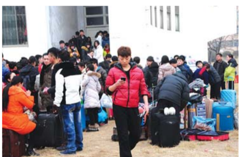
许多学生带着行李。