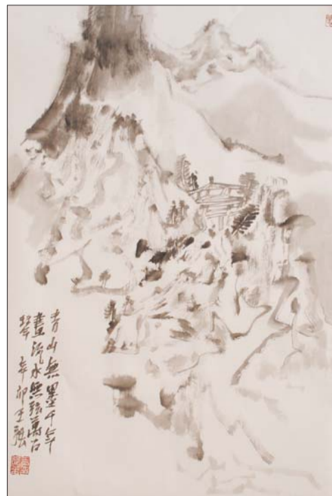
青山无墨千年画 流水无弦万古琴