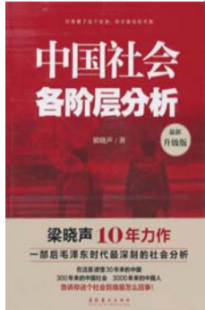
《中国社会各阶层分析》