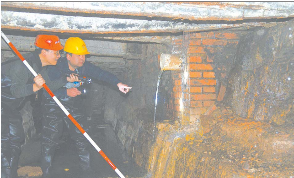
工作人员进入南门桥涵洞内,依次排查出现的排污口,在朝山街附近发现了一家酒店的排污管道。

2014年2月初 ,南门桥东侧涵洞再次流出乳白色的污水,在河面上略显蓝色,与正常的河水“泾渭分明”。