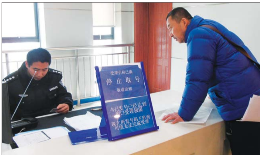
21日, 因为办业务的市民太多, 出入境大厅窗口摆出了停止取号提示牌。

记者从烟台交警部门了解到, 今年以来, 交警部门已5次开通绿色通道, 紧急护送病人入院治疗。