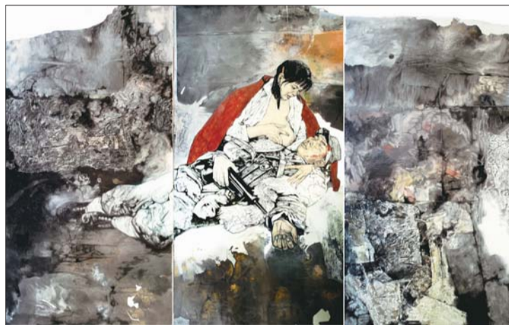
▲《红嫂》240x120cm 岳海波、李兆虬

在创作中,我们可以看到,画面在突出主体人物同时,也对其他“配角儿”进行了分组,场面宏大而有序;近处的战车、士兵与兵器,反映出齐国雄厚的军事实力;远景中的农耕场面、集市、商铺、盐业,则从侧面反映出人们的生活状况与