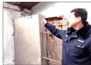
民警就是通过此处围墙爬上房顶救人的。