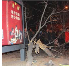
直径20厘米的槐树被拦腰撞断。

冯刚说,根据目前掌握的证据,驾驶员说法中存在疑点,具体原因还在进一步侦查之中。(奖励线索提供者刘先生100元)