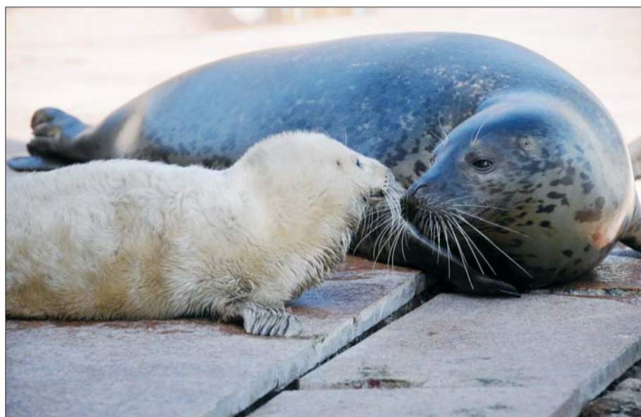
刚出生的小海豹憨态可掬,一直舍不得离开妈妈。本报记者 李泊静 摄

本报2月28日讯(记者 张姗姗) 最近,东炮台公园喜降两只可爱的海豹宝宝,又适逢3月1日国际海豹日来临,为此,东炮台公园特举办2014年欢乐海豹节活动。活动从3月1日起持续至3月31日,活动期间游客参观东炮台公园将享受多项优惠。公历生日为3月1日的游客,凭有效证件可在国际海豹日当天免费参观东炮台公园。