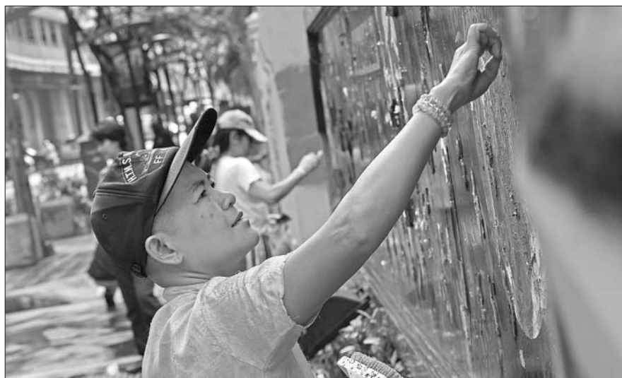
3月1日,泰国曼谷,反政府示威者清除皇家警察总署正门处的涂鸦。

根据《曼谷邮报》统计,自泰国去年10月底爆发反政府示威以来,至少20人在冲突中死亡,大约700人受伤。