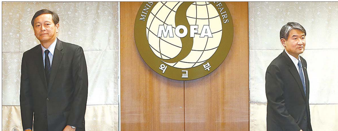
3月12日,韩国首尔,日本外务次官斋木昭隆(左)与韩国副外长赵太庸代表两国举行副部长级会谈。

据日本NHK电视台3月13日报道,日本外务次官斋木昭隆12日晚间提前结束他对韩国的访问,据日韩媒体分析,此行双方没有能就改善双边关系取得实质性进展,而日美两国之前力推的美日韩三方首脑会谈预计也将泡汤。