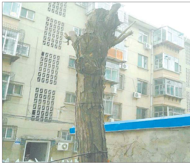
香椿树经过修剪,排除了隐患。