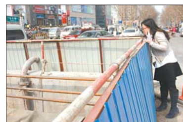
山大路与解放路交口仍在施工。

记者联系到负责该处电力施工项目的济南鲁源电气集团有限公司冯工,他解释,该项目为一处电缆施工项目,此处施工开口是山大路南口至解放路南电缆沟混凝土灌注的进出口,现在还不能封