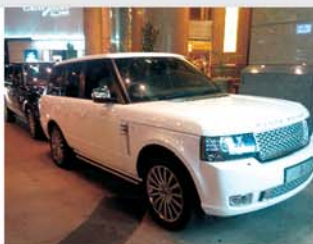
据说是最高元首出行用的车