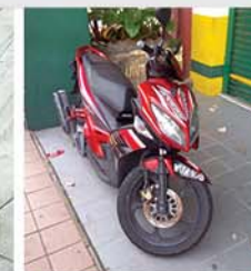
摩托车是出行利器