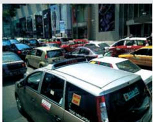
吉隆坡高峰期的大堵车