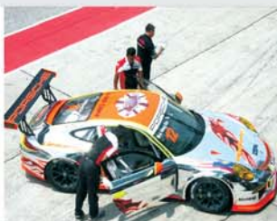
卡雷拉杯赛车正在准备跑圈