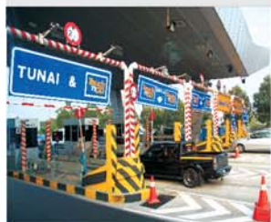
马来西亚高速收费非常便宜