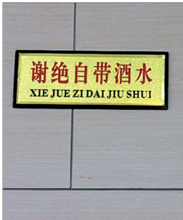
不少酒店门口张贴着这样的“霸王条款”。