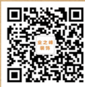
邹城业之峰官方微信

独家承办机构： YENOVA 业之峰装饰 技术顾问机构： 《中国消费者报》 首席监督媒体： 装修环保研究中心（中国环境科学学会 业之峰装饰联合成立）