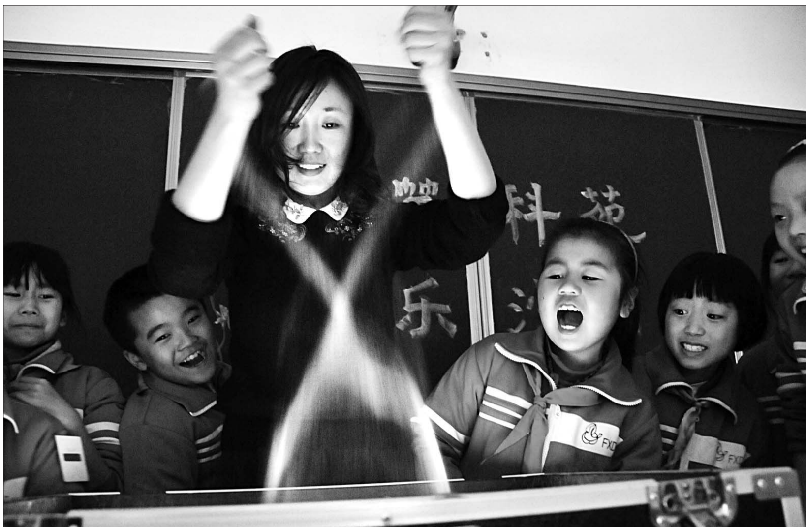
老师通过快速撒沙制作成一幅漂亮的沙画,让孩子们大呼过瘾。