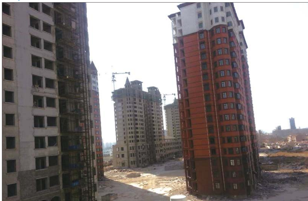
官家岛左岸尊邸项目进展缓慢,年后还未开工,已延迟交房好几年。