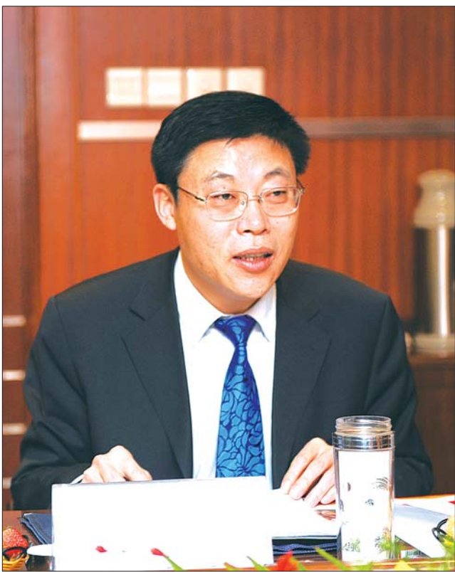
日照市工商局副局长秦绪方(资料片)