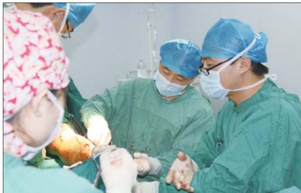
骨科大夫正在为患者进行手术治疗。

显微外科:自1990年开展首例断指再植手术,至今已开展300多例,成功率95%以上。2005年开展手指再造手术,至今完成近百例,失败一例。得益于精湛的血管吻合技术,在各种组织缺损、骨髓炎、骨不连等疑难病例的处理上均获得较好的