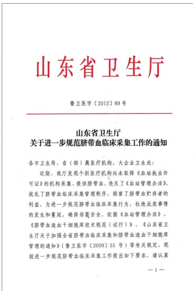
山东省卫生厅关于进一步规范脐带血临床采集工作的通知第89号文件

资料显示,自美国纽约血液中心于1992年成立世界第一家脐带血库以来,干细胞大规模保存正式开始。记者发现,现在脐带血保存单位鱼龙混杂,少数准父母轻信“李鬼”,导致在真正需