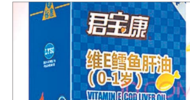
央视3·15晚会曝光的君宝康维E鳕鱼肝油。

他们生产的鱼肝油是归到企业备案的水产加工品里面去的。也就是说,康诺邦公司竟然是利用了水产加工品的企业标准,将本应是药品的鱼肝油,违规生产成婴幼儿食品。