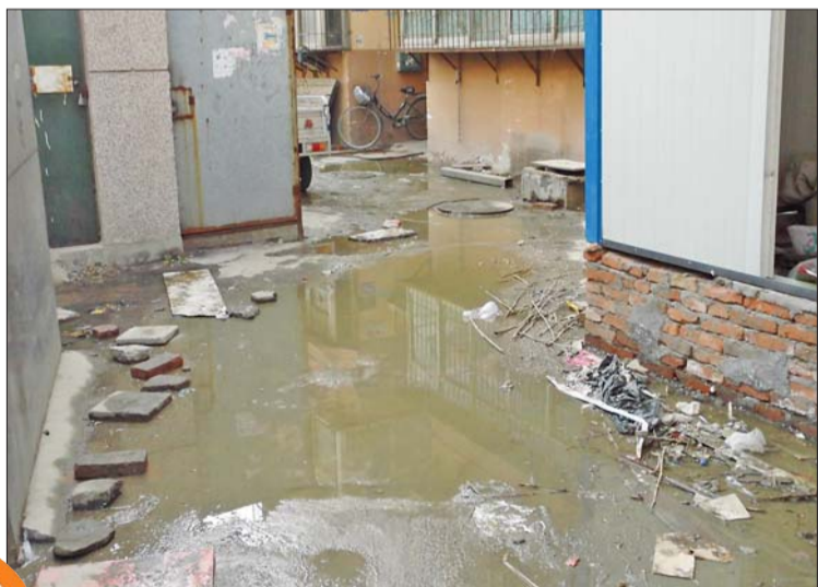
化粪池污水从下水道井盖流出。