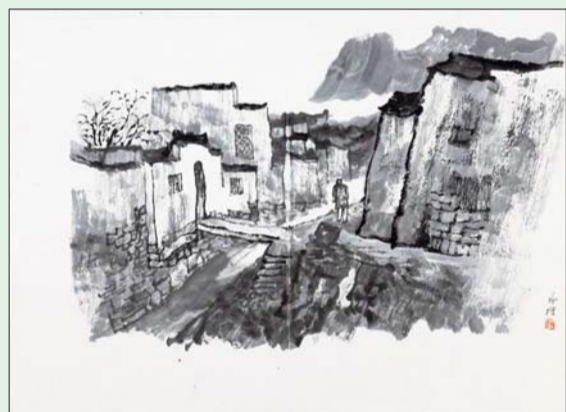
▲水墨写生-西递22 41 × 56cm

2013年,我参加活动很少,外出多数时间都在写生,画了许多民居题材的作品。我很喜欢写生的过程,写生期间,因为减少了与外界联系,自己得以慢下来、静下来,去思考一些事情,白天画画,晚上整理,创作状态非常好。与前几年相比,我觉得自己现在的创作更有意思了,也更符合水墨的表现方式,所以,2014年除了展览活动,我还准备去乌镇一带写生,往更南方走走,江南的灵秀也将带给我更大的触动。其实,创作的过程,就是只画心有所感的作品,追寻内心深处的感动。