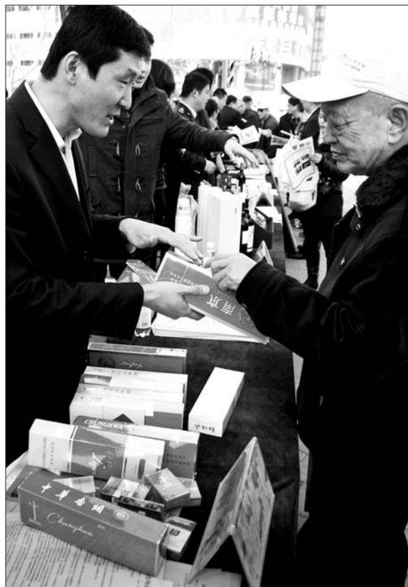
市烟草专卖局的工作人员为市民讲解如何辨别假烟,不少市民拿出自己的烟让工作人员辨别。