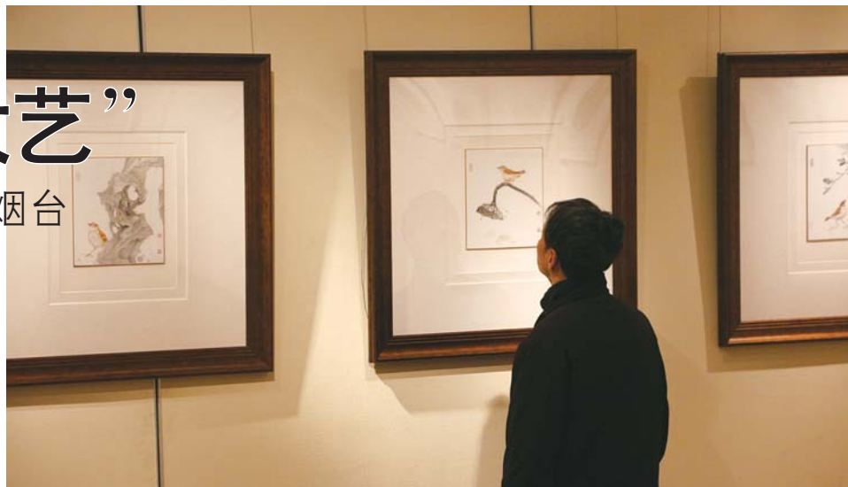
一位参观的市民,在作品前细细品研。

日前,“方寸之间——当代中青年艺术家迎春小品雅集展”在烟台市群众艺术馆展厅正式展出。汇聚全国各地30位中青年画家,120幅精心完成的书画小品之作,堪称2014年以来烟台群众艺术馆规模最大的一次展出。据悉,此次展览截止到本月26日。