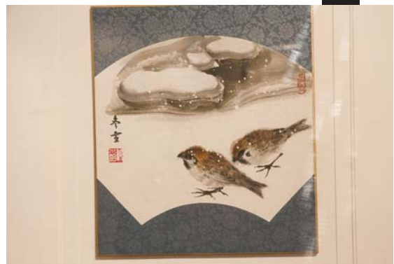
孙小钧的画作《冬雪》

孙小钧说,此次展览还有一个很明显的特点,“70后”及之前的书画家创作的作品,传统的艺术内容更多一些,而“80后”的书画家就多了对艺术作品的自我想法和认识。