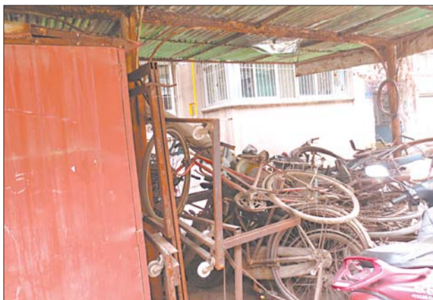
和平新村18号院,废弃物数没人管。

“先要确定是不是无主堆积物,我们准备先在院内张贴通知,让所有者及时清理,如果3-5天还没有人清理的话,居委会将上报办事处按照无主处理,由环卫所进行清理。”该工作人员告诉记者。