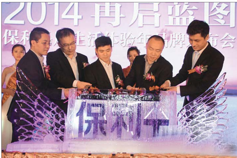
2014保利品质生活体验年正式启动

2014年3月16日下午,保利置业2014品牌战略发布会(烟台站)启动仪式在烟台东山宾馆美术馆圆满落幕。精彩的品牌战略解读,一轮轮的惊喜大抽奖,现场的魔术表演更是将活动推向高潮。从2013品质生活年到2014品质生活体验年,烟台保利置业2014年的品牌战略规划在当天引发各界人士的深度赞誉以及热烈讨论。