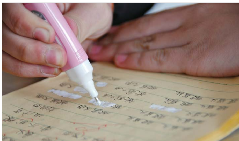
不少学生写作业时还在用有毒涂改液。

近日,央视3·15晚会曝光涂改液甲苯超标34倍,呼吁家长别再让孩子使用涂改液。近日,记者从市中心城区多所学校了解到,使用过涂改液的孩子超过半数以上,而且类似涂改液的各种涂改文具五花八门,老师们表示这些文具对孩子是百害而无一利,不仅影响健康,还不利于良好书写习惯的养成。