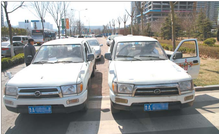
◀查扣的非法教练车并没有挂黄色的专用车牌,而是蓝色的普通社会车牌。

本报3月21日讯(见习记者 万兵) 21日,济南市交通运输监察支队根据群众举报,在高新区巨野河办事处附近端掉一个黑驾校培训点,并查扣全部6辆非法教练车,全程仅用了不到10分钟。