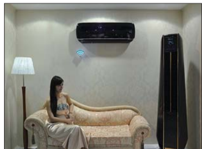
海信空调苹果派A8(890挂机、890柜机)