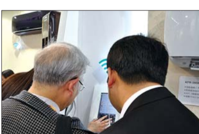
家博会观众热情参与海信空调智能体验

据国家电网发布的《中国高端家电市场报告》显示,目前已经有40.7%的用户选择了家电“智能化”这一属性,预计到2015年,这个数据会上涨到60%,未来智能空调将会有巨大的市场空间。