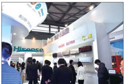
海信空调苹果派A8系列产品亮相上海家博会

据国家统计局创办的中怡康统计机构数据显示,2013年海信空调零售同比增长54.32%,成为行业增速最快的品牌。今年2月23日,海信空调在发布了“空调A时代海信苹果派”跨时代的精品引发业界高度关注,海信以全新能效标准(APF)、空气净化(Air-washer)、智能化(smArt)、艺术化(Art)的产品拉开了空调“A时代”的序幕。