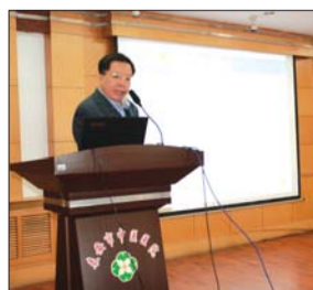
李为教授正在上课。

21日,全国人工关节临床新技术与新进展学习班在泰安市中医医院会议室召开。全国知名教授授课,为骨科医生提供互动式培训,解答和解决医生手术中遇到的实际操作和理论问题。