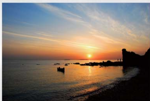
渤海日出