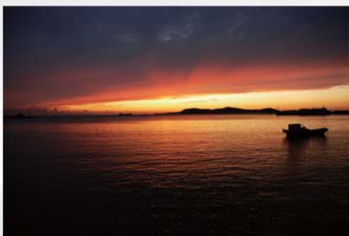
油画般的海景