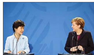
26日,朴槿惠与默克尔在柏林出席发布会。

韩国总统朴槿惠28日在德国东部城市德累斯顿发表演讲,向朝鲜提出三大倡议,以期作为朝韩构建互信的第一步,为统一奠定基础。一些韩国政府官员说,预计朝方会作出积极回应。