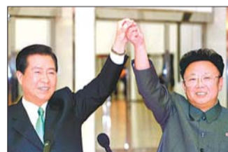
2000年6月14日,金正日在平壤会晤来访的金大中。(资料片)

韩联社称,朴槿惠这次演说是她上任以来表达统一愿景的“高潮”。之所以选择在德国提出倡议,是因为德国曾经东西分裂,最终统一,对朝鲜半岛而言有借鉴价值。朴槿惠说,她相信德国之所以能够相当快克服统一后的余悸,达到今天的融合程度,是因为东西德统一前持续开展民间交流。