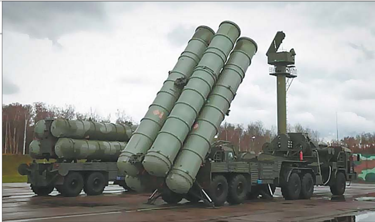
俄罗斯S-400“凯旋”防空系统