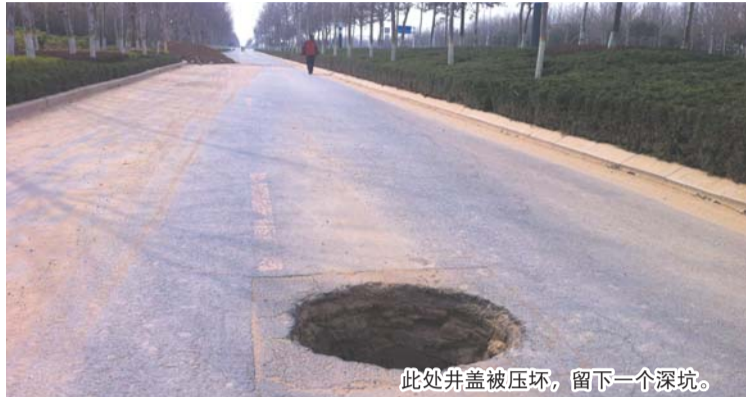
此处井盖被压坏,留下一个深坑。

随后记者拨打市政热线,工作人员表示,会将情况及时反馈给相关部门,安排工作人员前往进行调查,尽快将道路雨水井盖修好。