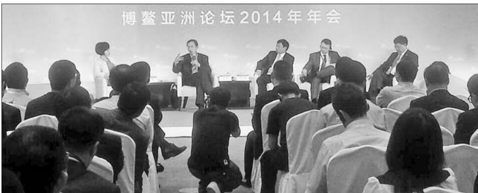
博鳌亚洲论坛分论坛“楼市2014:从调控到改革”上,各位大佬围绕房地产金融化的热点话题,各抒己见。

“35年前,中国在南方开了一个圈,打开了封闭很久的窗口,成功融入国际经济体系,快速成为世界第二大、亚洲第一大经济体。35年后,中国又在南北画了两条线,一条沿陆,一条沿海。”中国海外交流协会常务副会长袁媛平以改革开放作类比,一语点明21世纪中国新丝绸之路的蓝图构想。