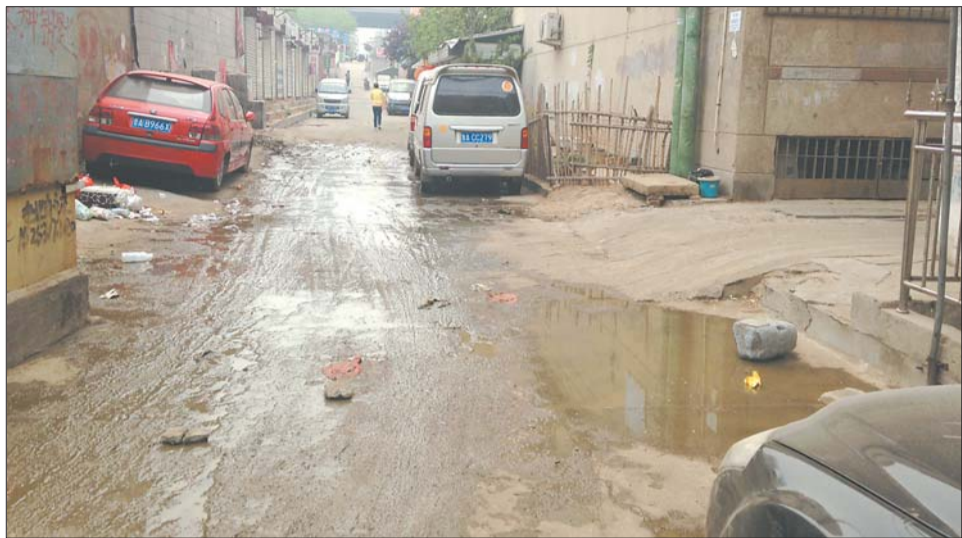
▲污水流了一地,居民出入都费劲。