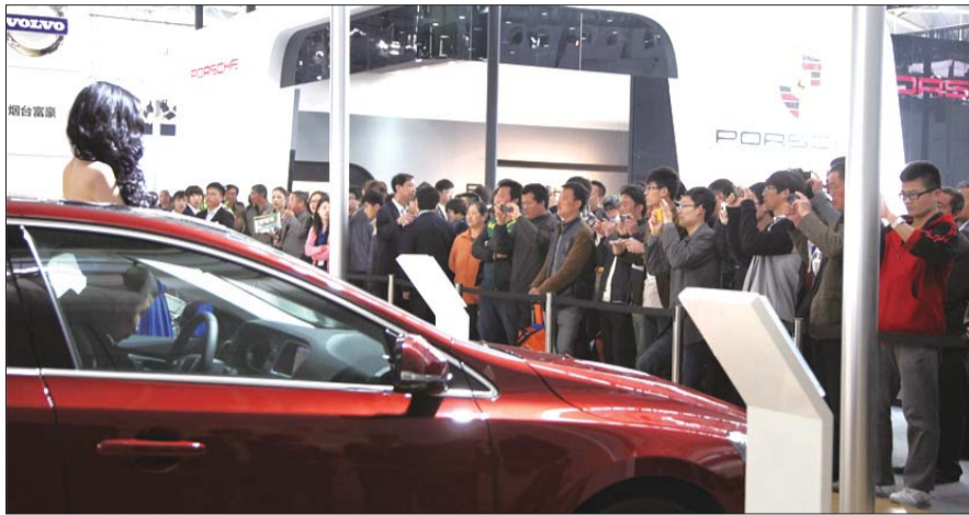
车展现场火爆,两天吸引了近7万市民观展,卖出3500台车。

10日,2014烟台春季汽车展启幕。尽管是工作日,开馆两天来仍吸引了近7万人参展,售出3500台车,这些数据着实超过了组委会及各大参展商的预想。在车展火爆现场的背后,是烟台市民强大的购买力,以及汽车产业的蒸蒸日上。